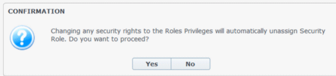
Figura: Diálogo de Confirmação

Se os privilégios da função do usuário forem alterados neste módulo e já não coincidirem mais com os privilégios definidos no módulo Funções , a seguinte caixa de diálogo será exibida: